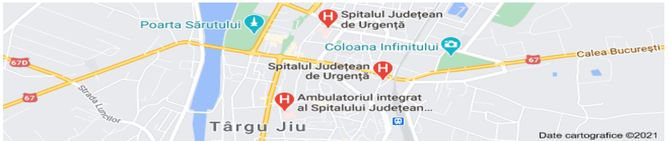
Figura 1-Localizarea pe hartă a Spitalului Județean de Urgență Târgu Jiu

În anul 2021, Spitalul Județean de Urgență Târgu Jiu a funcționat conform ultimei modificări a structurii organizatorice, aprobată prin Dispoziția Președintelui Consiliului Județean Gorj nr. 1050 din 11.12.2019, cu un număr de 1009 paturi spitalizare continuă și 69 paturi spitalizare de zi, distribuite în 22 de secții și un compartiment, din care 67% reprezintă paturi pentru specialități medicale, 29% din paturi pentru specialități chirurgicale și 4% din paturi pentru specialități ATI, amplasate în cele trei locații ale spitalului.